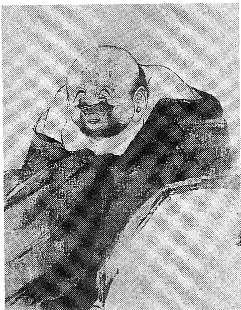
図1 梁楷「布袋和尚図」

本稿では、中日画家が描いた「布袋図」の中から、それぞれ2例、併せて4例を選んだ。第1例は中国南宋の梁楷「布袋和尚図」(図1)、第2例は中国明代の張宏(1577-1640)「布袋羅漢図」(図2)、第3例は江戸中期の柳里恭(1704-1758)「布袋図」(図3)、第4例は江戸中期の