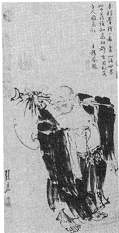
図2 張宏「布袋羅漢図」