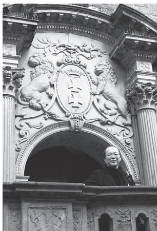
Ratusz Głównego Miasta, Gdańsk 2012 r.