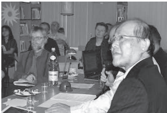
Spotkanie z Shiki Team, Gdańsk 2012 r.