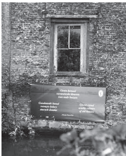
Baner wiszący wzdłuż rzeki Leie, Gandawa 2010

Castle of Ghent the closer I get the less I see