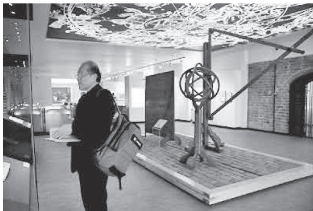
Muzeum Mikołaja Kopernika, Frombork 2012 r.